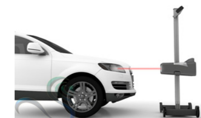
Kruislaser voor exacte bepaling midden koplamp