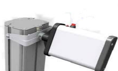
Laser voor het perfect positioneren van de tester voor het voertuig.