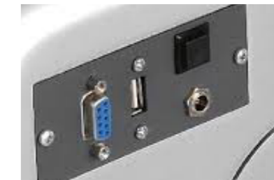
De Moon is standaard uitgevoerd met een RS232 en USB poort voor o.a. software update enz.