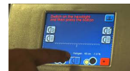
5,7 inch touchscreen voor heldere weergave van live meetwaarden. 180 graden verdraaibaar en bedienbaar ook met handschoenen.