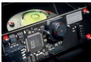
CMOS-camera met hoge resolutie en beeldsnelheid zorgen voor een zeer nauwkeurige meting.