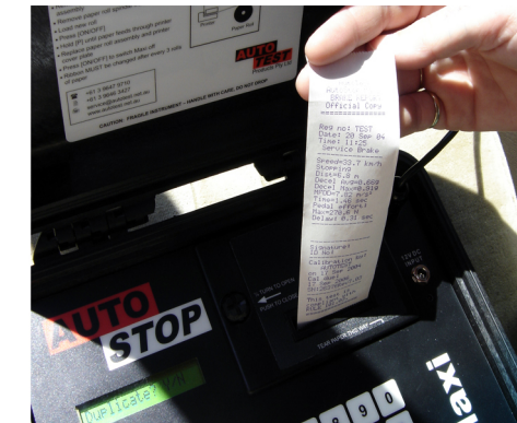
Printen van de testresultaten