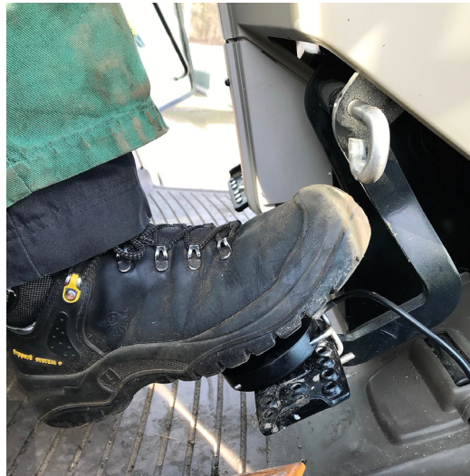
Standaard geleverd met pedaalkrachtmeter